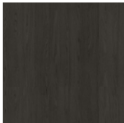
Legno massello Frassino carbone

Materiali, tessuti, colori e finiture sono puramente indicativi e possono variare da quelli attualmente rappresentati. Potete trovare la collezione completa di tessuti e pelli nel sito dedicato https://bonaldo.biz