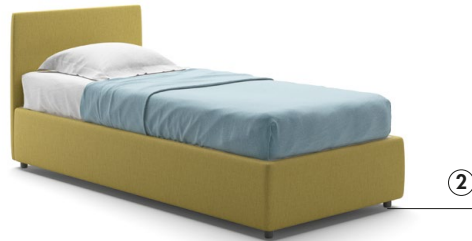
PEGASO LETTO / Bed