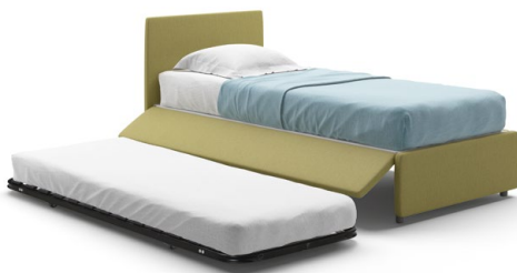
01 - PEGASO CON 2° RETE PER MATERASSO DA 15 CM / Pegaso with 2nd bed base for 15 cm wide mattress

Ruote piroettanti disponibili sono per letto fisso e con contenitore Castors available for fixed bed and storage bed