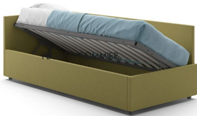
01 - PEGASO CON CONTENITORE / With storage unit