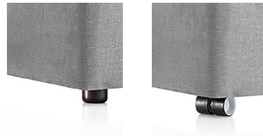
Piedino cilindrico Cylindrical foot